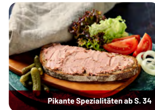
Pikante Spezialitäten ab S. 34