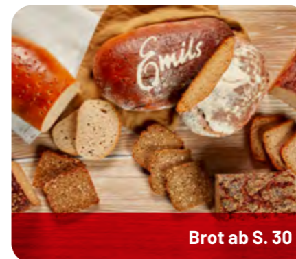
Brot ab S. 30