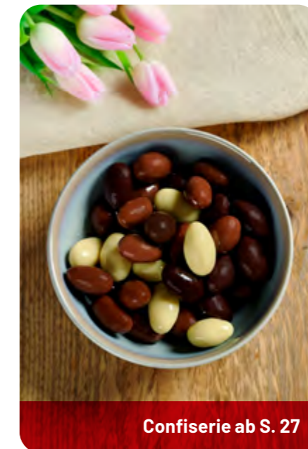
Confiserie ab S. 27