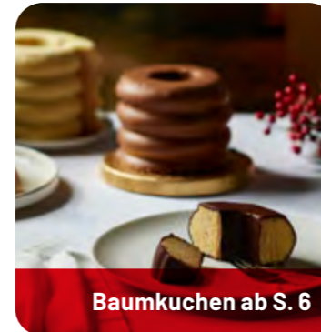
Baumkuchen ab S. 6