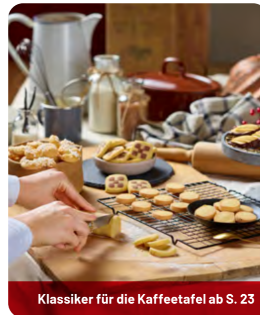
Klassiker für die Kaffeetafel ab S. 23