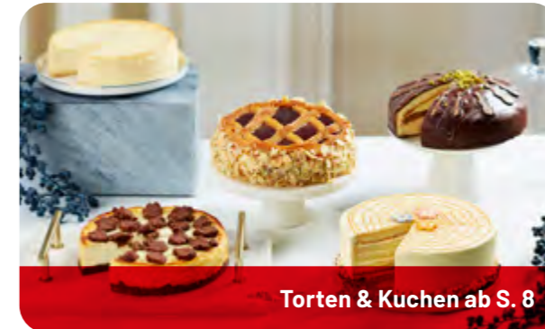
Torten & Kuchen ab S. 8